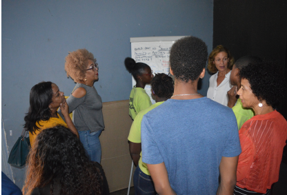
Le Lamentin, janvier 2019