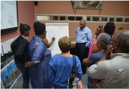
Fort-de-France, novembre 2018