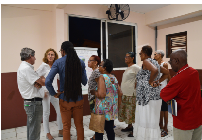
Macouba et Grand'Rivière, juillet 2019