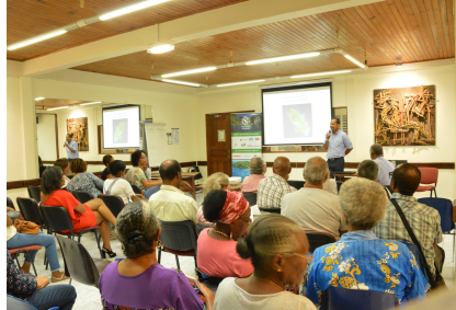
Les Trois-Ilets, mars 2019