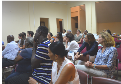
Saint-Pierre, janvier 2019