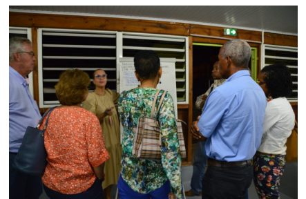
Le Robert, octobre 2019