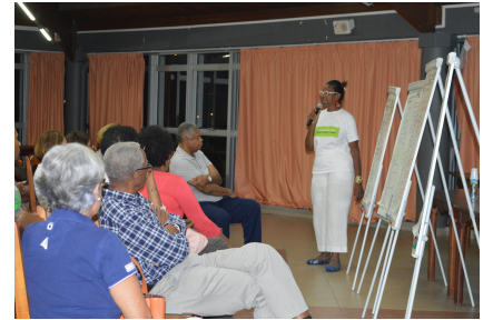
Le François, janvier 2019