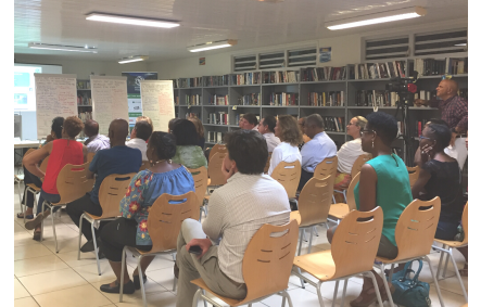
Ducos, juillet 2019