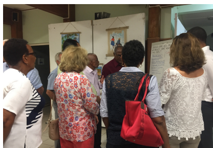
Saint-Joseph, juillet 2019